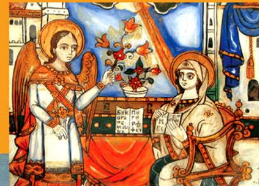
Școala și Biserica

Conștientizarea și exersarea unor valori; Identificarea și valorificarea patrimoniului cultural local.