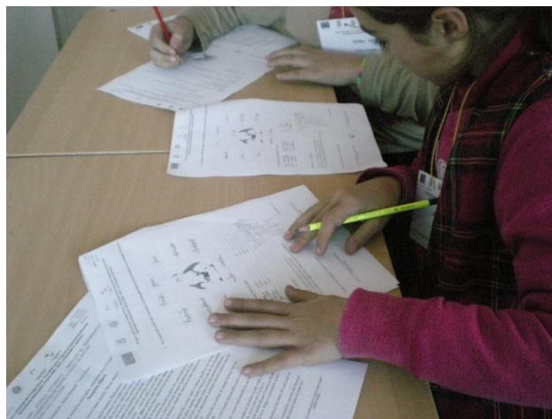
Citim povestea și rezolvăm sarcinile de lucru